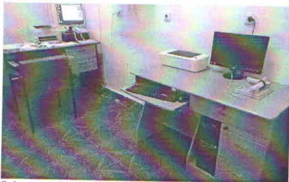
Spirometru CareFusion – Laborator Explorări Funcționale