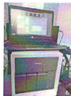
FIG 4. GeneXpert

Primirea aparaturii noi a necesitat amenajări susținute din veniturile proprii ale spitalului și reorganizarea spațiilor și a întregii activități din laborator.