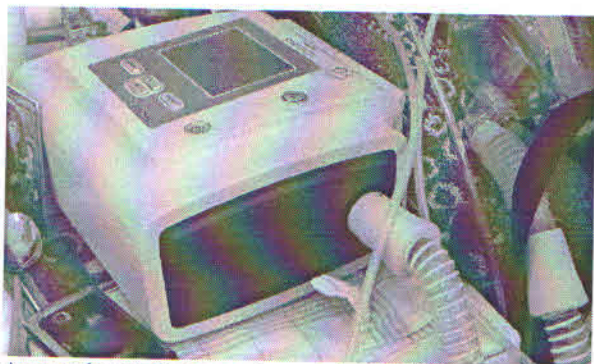
Aparat de ventilație noninvazivă (BIPAP)