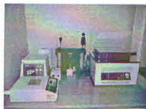
Fig 3. Sistemul GenoType_HAIN

Echipamentele destinate metodelor genetice sunt GenoType-HAIN, și GeneXpertMTB/Rif. Ambele pot detecta simultan prezența bacteriei tuberculozei ( Mycobacterium tuberculosis ) și rezistența sa la medicamentele majore folosite pentru tratament (rifampicina și izoniazida- primul echipament, respectiv rifampicina- al doilea). Rezultatul se obține în 48, respective 2 ore