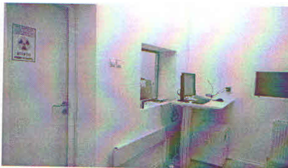
Cameră de comandă Aparat RX MULTIX Select DR