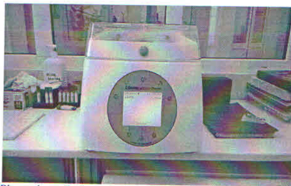
Plasmatherm Barkey – Secția Chirurgie Toracică

În cadrul spitalului se desfășoară două Programe Naționale de Sănătate :