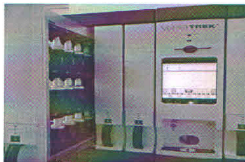
Fig 2. Sistemul de cultivare VersaTREK

Ultimul echipament, sistemul automat de cultivare a micobacteriilor și testarea sensibilității la substanțele anti-tuberculoase, VersaTREK, permite cultivarea simultană a 240 culturi. Avantajul major al folosirii acestor sisteme de cultivare este scurtarea timpului mediu de aflare a rezultatului pozitiv de la 26 la 17 zile pentru cultură și de la 21-28 zile, la 7-10 zile pentru testul de sensibilitate.