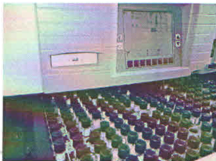
Fig 1. Sistem de cultivare MGIT 960.

Primul echipament primit, sistemul automat de cultivare a micobacteriilor și testarea sensibilității la substanțele anti-tuberculoase, MGIT 960, permite cultivarea simultană a 960 culturi.